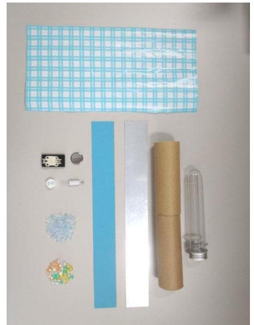
・主な工作パーツ