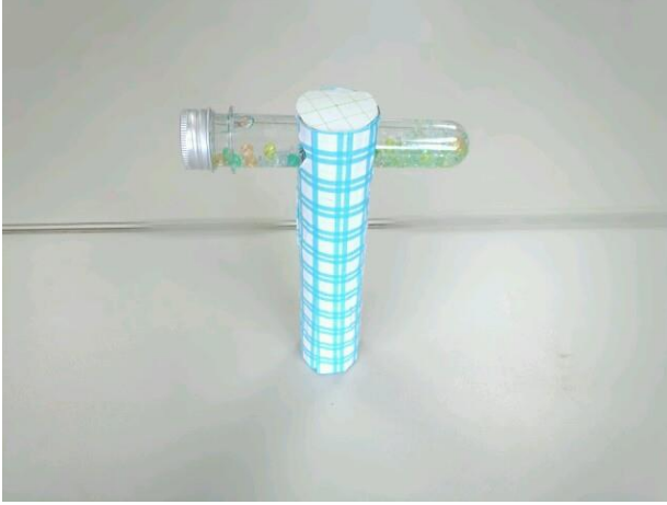
・LED ワンドタイプ万華鏡