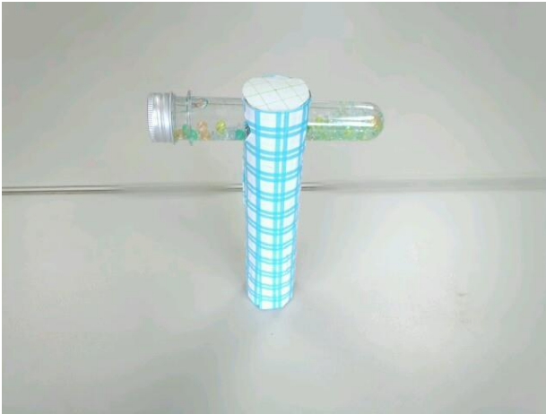
・LED ワンドタイプ万華鏡