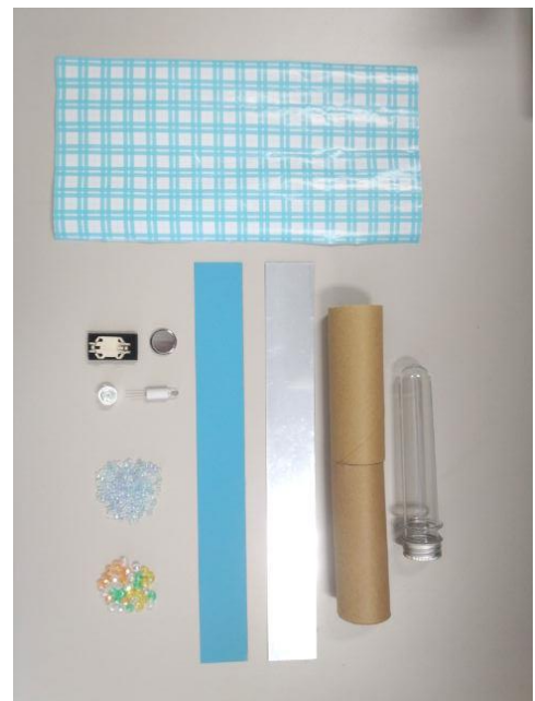
・主な工作パーツ