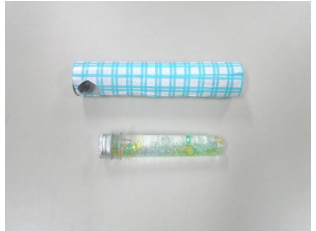
・万華鏡本体とオイルワンド